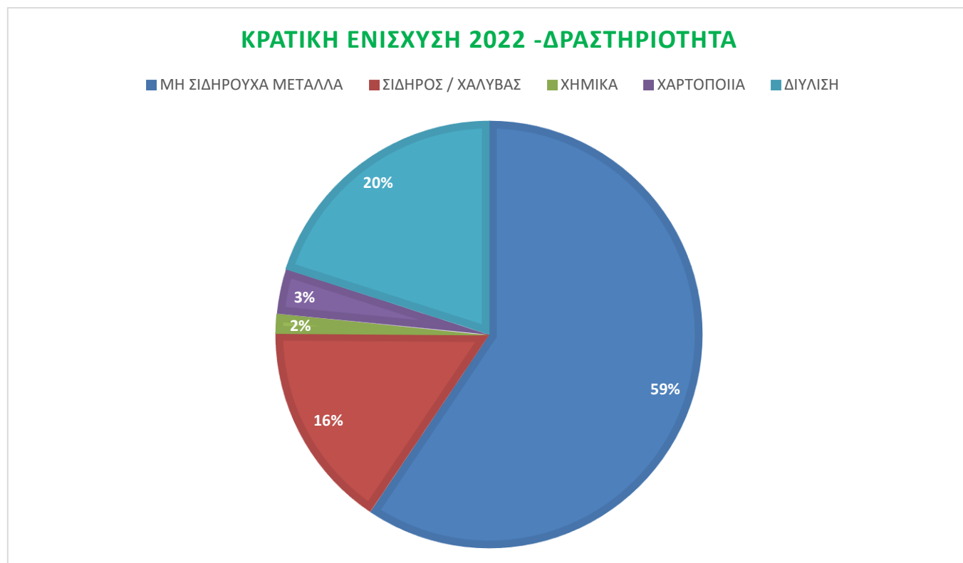
Σχήμα-1: Συνοπτικά αποτελέσματα Ετήσιας Εκκαθάρισης Αντιστάθμισης του έτους 2022

Στο παρακάτω Σχήμα-1 παρατίθενται συνοπτικά τα αποτελέσματα της Ετήσιας Εκκαθάρισης Αντιστάθμισης του έτους 2022 ανά βιομηχανική δραστηριότητα: