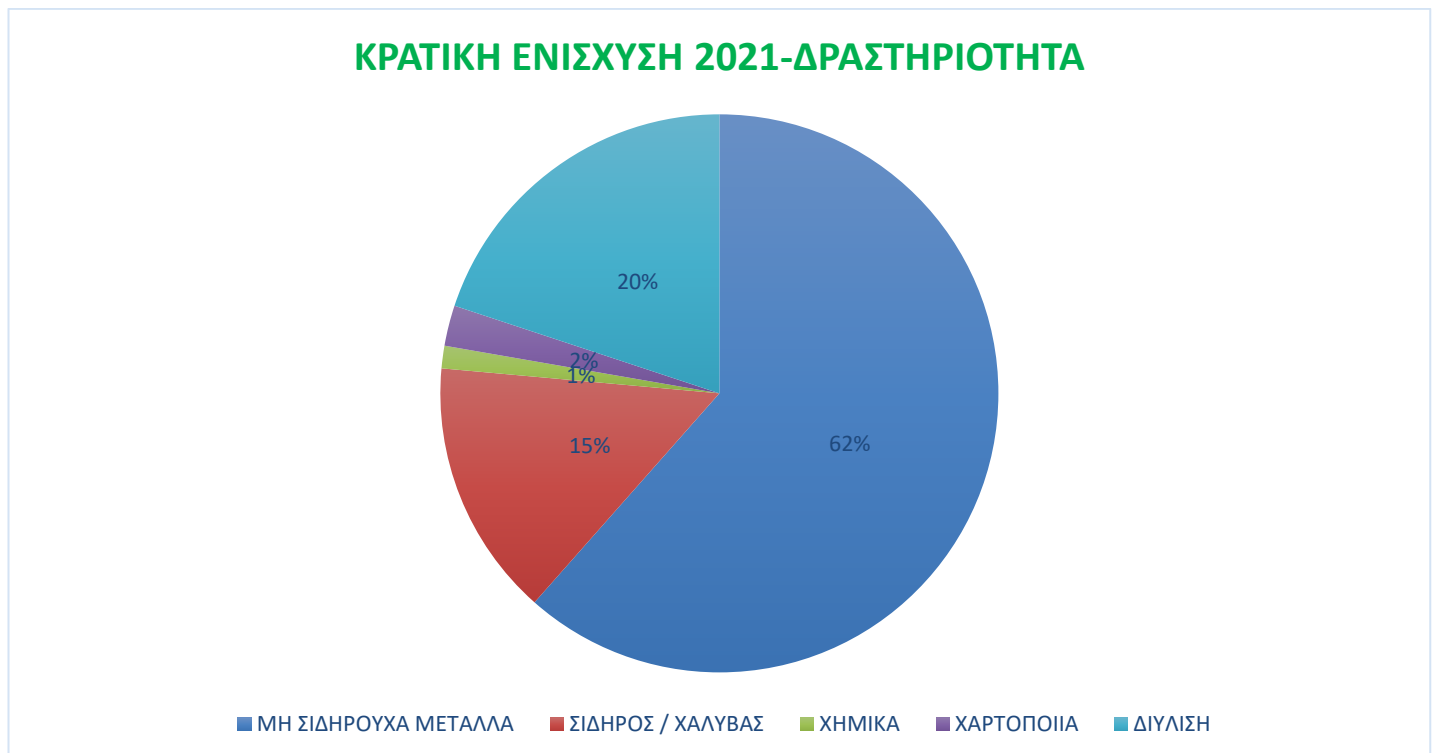
Σχήμα-1: Συνοπτικά αποτελέσματα Ετήσιας Εκκαθάρισης Αντιστάθμισης του έτους 2021

Στο παρακάτω Σχήμα-1 παρατίθενται συνοπτικά τα αποτελέσματα της Ετήσιας Εκκαθάρισης Αντιστάθμισης του έτους 2021 ανά βιομηχανική δραστηριότητα: